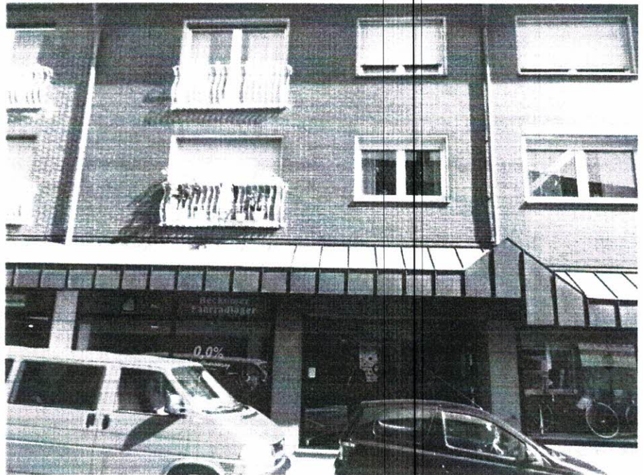
09 Teilansicht von Westen

Beratung · Entwurf · Planung · Objektüberwachung · Bauleitung · Bauantrag · Gutachten