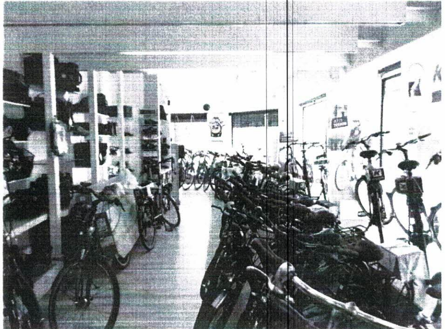
07 Innenansicht Ladenlokal

Beratung · Entwurf · Planung · Objektüberwachung · Bauleitung · Bauantrag · Gutachten