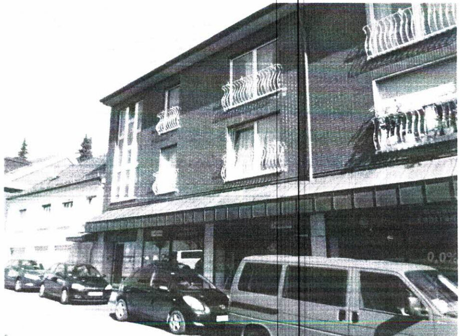
08 Teilansicht von Westen