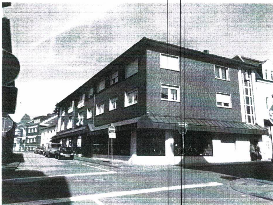
01 Ansicht von Süd- Westen

Beratung · Entwurf · Planung · Objektüberwachung · Bauleitung · Bauantrag · Gutachten