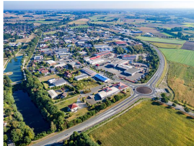
Blick auf das Gewerbegebiet Olfen-Hafen