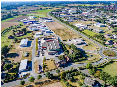
Blick auf das Gewerbegebiet Olfen-Ost. Im Hintergrund: