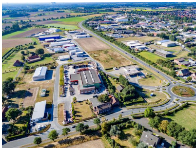
Blick auf das Gewerbegebiet Olfen-Ost. Im Hintergrund: