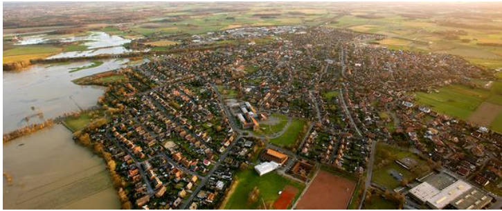
Blick auf die Stadt Olfen. Am linken Bildrand: Die Steveraue