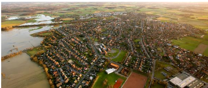
Blick auf die Stadt Olfen. Am linken Bildrand: Die Steveraue

Dass dies bei den Verantwortlichen in den Unternehmen geschätzt wird, zeigt das stetige Wachstum der Olfener Gewerbegebiete in den vergangenen Jahren. Auch die Zahl der sozialversicherungspflichtigen Arbeitsplätze konnte seit 1999 um 37,5 % gesteigert werden.