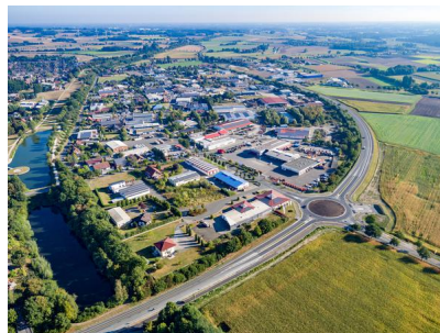
Blick auf das Gewerbegebiet Olfen-Hafen