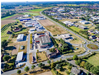
Blick auf das Gewerbegebiet Olfen-Ost. Im Hintergrund: