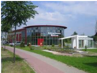
Einfahrtsituation Gewerbeparks Kiebitzpohl.JPG