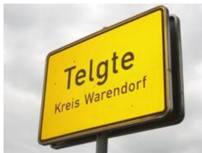
Telgte im Kreis Warendorf.JPG