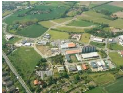
Luftbild Gewerbeparks Kiebitzpohl.JPG