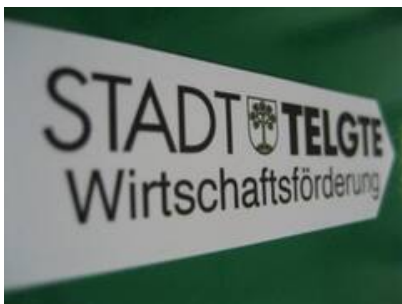
Wir freuen uns über Ihren Anruf 02504 13298.JPG