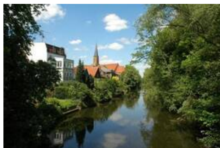
Lebenswerte Stadt - Emsblick.JPG