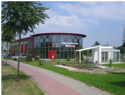
Einfahrtsituation Gewerbeparks Kiebitzpohl.JPG