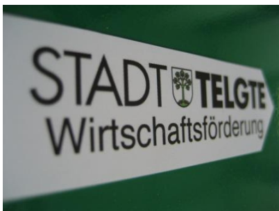
Wir freuen uns über Ihren Anruf 02504 13298.JPG