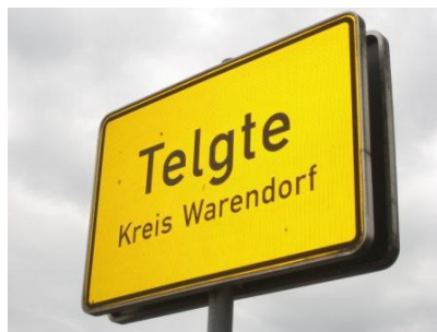
Telgte im Kreis Warendorf.JPG