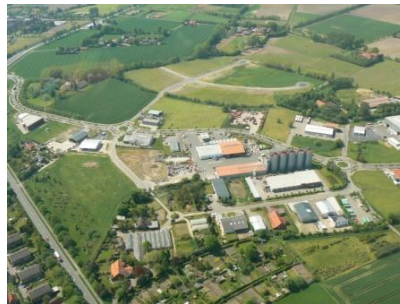
Luftbild Gewerbeparks Kiebitzpohl.JPG