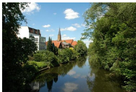
Lebenswerte Stadt - Emsblick.JPG