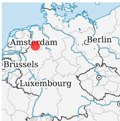
Lage in Deutschland