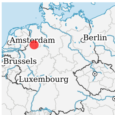
Lage in Deutschland