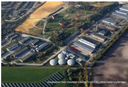
Krampe Fahrzeugbau im Industriepark Nord.Westfalen