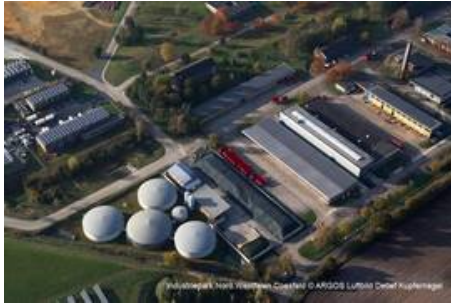
Biogasanlage im Industriepark Nord.Westfalen