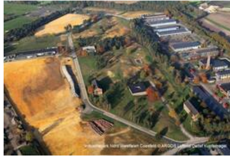
6.3 ha Industriefläche im Industriepark Nord.Westfalen