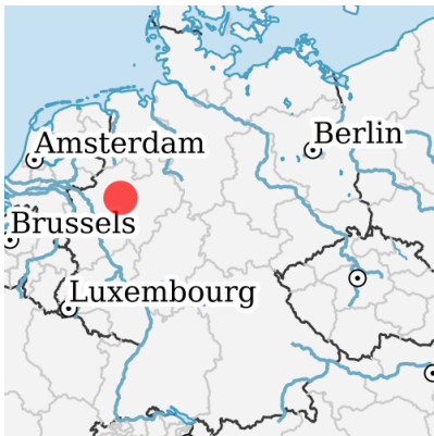
Lage in Deutschland