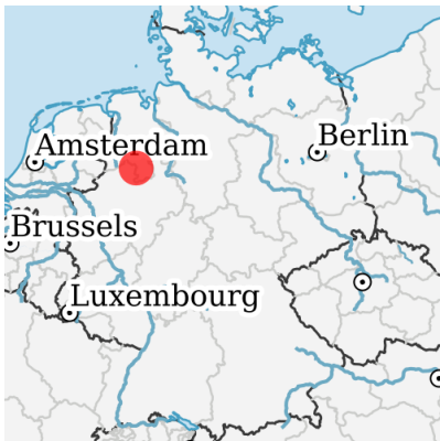
Lage in Deutschland