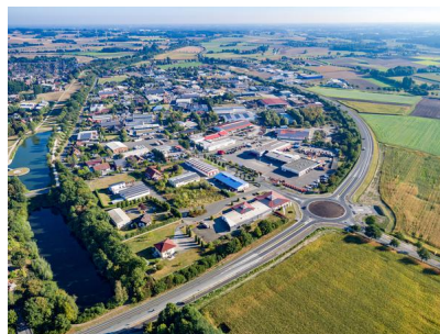
Blick auf das Gewerbegebiet Olfen-Hafen