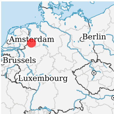
Lage in Deutschland