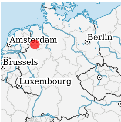
Lage in Deutschland