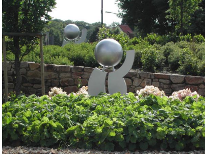
Kreisverkehr im Zentrum