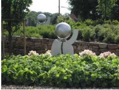
Kreisverkehr im Zentrum