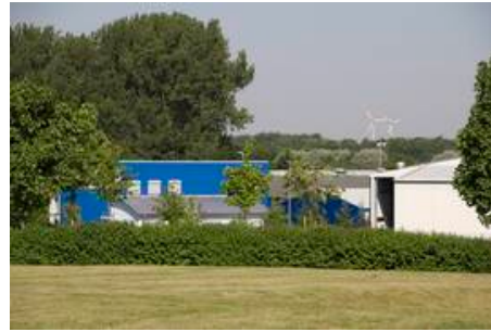
Natur- und Gewerbepark Olfetal