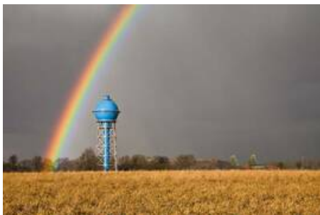
Historischer Ahlemer Wasserturm

„Kaskade“ nennt sich der Wasserfall aus Licht des isländischen Künstlers Egill Saebjörnsson, der sich nach Einbruch der Dunkelheit über die gewellte Metallfassade des Kunstmuseums Ahlen ergießt. Das Kunstmuseum Ahlen der Theodor Leifeld Stiftung, zeigt seit 1993 zeitgenössische Kunst für jedermann. Nur 500 Meter weiter auf dem Marktplatz, steht die Bartholomäuskirche aus dem Jahr 800. Diese Keimzelle der Stadt stellt alljährlich im Sommer eine historische Kulisse für das Stadtfest und die Sommerprogrammreihe „Tralla City“ dar. Jährlich wird auf dem „Pöttkes- und Töttkenmarkt“ im September den rund 10.000 Besuchern traditionelle Handwerkskunst präsentiert. Die historische Ahlemer Innenstadt, verspricht mit ihrer Mischung aus Gründerzeitfassaden und Ackerbürgerarchitektur, ein stimmungsvolles und authentisches Einkaufserlebnis. Neben bekannten Einzelhandelsketten, gibt es auch traditionelle Fachgeschäfte entlang der Ost- und Weststraße innerhalb der Ahlemer Einkaufsmeile. Für Liebhaber von Sport- und Outdooraktivitäten bieten sich in Ahlen und Umgebung vielfältige Freizeitmöglichkeiten. In der ehemaligen Zeche Westfalen locken das „BigWall Kletterzentrum“ und die „Soccerkaue“ an. Auf der Römer-Lippe-Route, dem Werse Rad Weg, der 100-Schlösser-Route oder den vielfältigen innerstädtischen Radwegen, finden erholungssuchende Radfahrer einen Ausgleich.