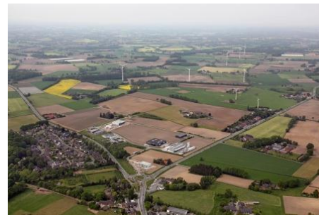
Luftbildansicht Gewerbegebiet Holtwick