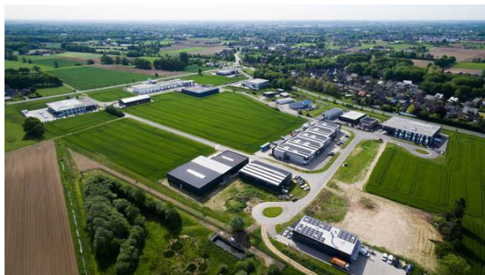
Luftbildansicht Gewerbegebiet Holtwick