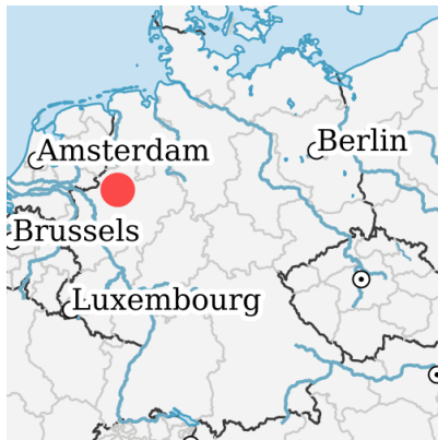
Location in germany