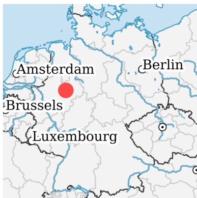
Lage in Deutschland