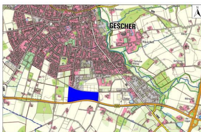
Das Gebiet liegt im Süden des Stadtgebietes der Glockenstadt