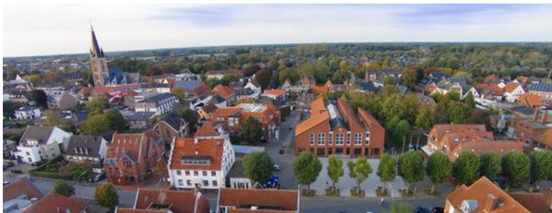
Gescher hat ein attraktives Zentrum.