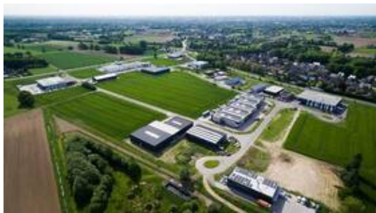
Luftbildansicht Gewerbegebiet Holtwick