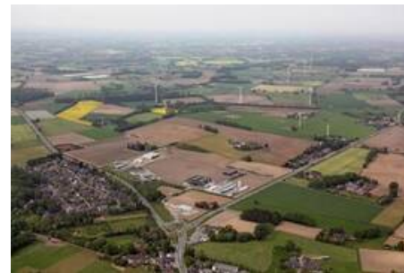
Luftbildansicht Gewerbegebiet Holtwick