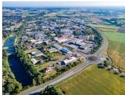
Blick auf das Gewerbegebiet Olfen-Hafen