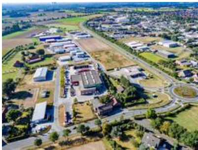
Blick auf das Gewerbegebiet Olfen-Ost. Im Hintergrund: