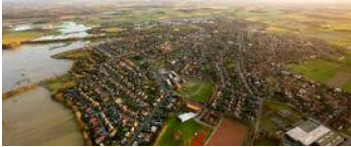
Blick auf die Stadt Olfen. Am linken Bildrand: Die Steveraue

Dass dies bei den Verantwortlichen in den Unternehmen geschätzt wird, zeigt das stetige Wachstum der Olfener Gewerbegebiete in den vergangenen Jahren. Auch die Zahl der sozialversicherungspflichtigen Arbeitsplätze konnte seit 1999 um 37,5 % gesteigert werden.