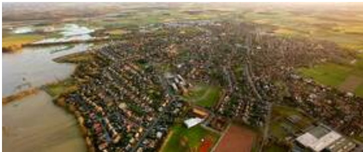
Blick auf die Stadt Olfen. Am linken Bildrand: Die Steveraue

Dass dies bei den Verantwortlichen in den Unternehmen geschätzt wird, zeigt das stetige Wachstum der Olfener Gewerbegebiete in den vergangenen Jahren. Auch die Zahl der sozialversicherungspflichtigen Arbeitsplätze konnte seit 1999 um 37,5 % gesteigert werden.